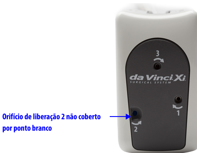
Figura 3 Orifício de liberação 2 não coberto por ponto branco

Se o orifício de liberação 2 não estiver coberto pelo ponto branco (Figura 3), não será necessário girar a ferramenta no orifício de liberação 1. A tentativa de girar a ferramenta no orifício de liberação 1 poderá resultar em quebra da ferramenta.