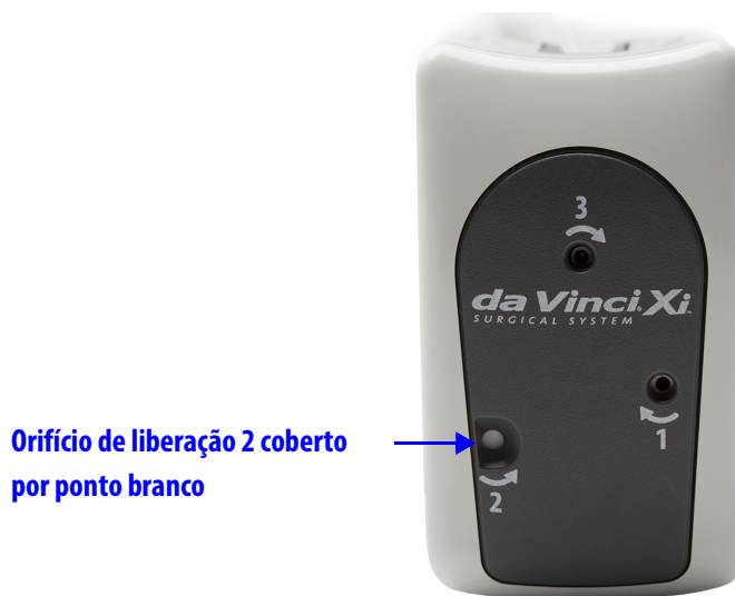
Figura 2 Orifício de liberação 2 coberto por ponto branco

Antes de usar o Kit de Liberação do Stapler, examine o orifício de liberação 2 no invólucro do instrumento. Se o orifício de liberação 2 estiver coberto por um ponto branco (Figura 2) e não estiver acessível, a ferramenta precisa ser girada no orifício de liberação 1 primeiro, em seguida nos orifícios de liberação 2 e 3.