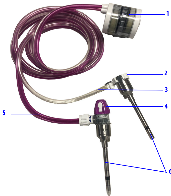
Figura 1 Produtos ConMed AirSeal com acessórios da Vinci X e Xi

A imagem abaixo representa uma configuração completa dos produtos ConMed AirSeal com acessórios da Vinci X e Xi. Consulte a Tabela 2 para obter uma lista completa de Vedadores de Cânula da Vinci X/Xi compatíveis.